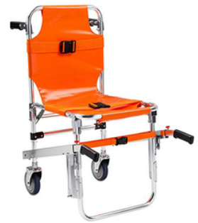
BRANCARD CHAISE 2 ROUES CHAIR 2