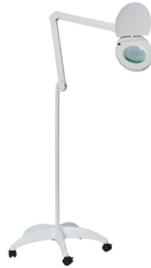
LAMPE LOUPE SUR ROULETTES