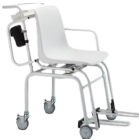
FAUTEUIL DE PESÉE EN POSITION ASSISE - SECA