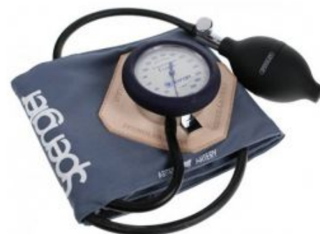
TENSIOMÈTRE VAQUEZ LAUBRY HÔPITAL VELCRO