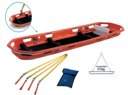
BRANCARD SECOURISME EN PVC HELICO BASKET