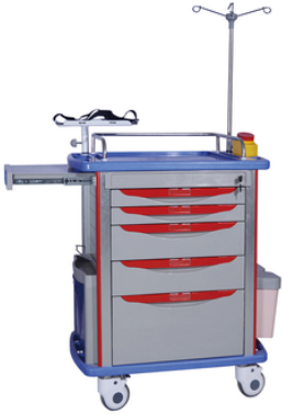
CHARIOT SOINS D'URGENCE ABS - MM