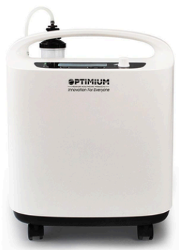
CONCENTRATEUR À OXYGÈNE 5L