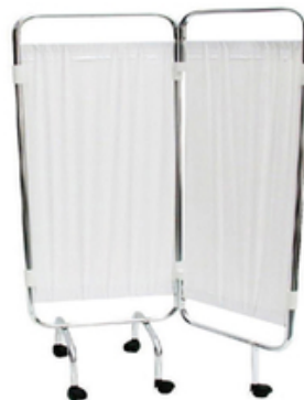
PARAVENT INOX 2 VOLETS