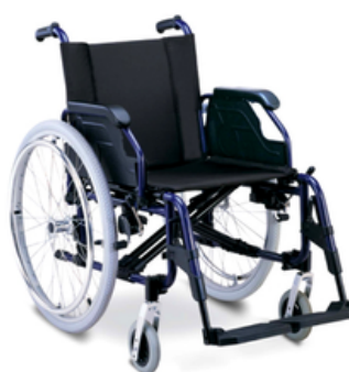
FAUTEUIL ROULANT ADULTE CHIC