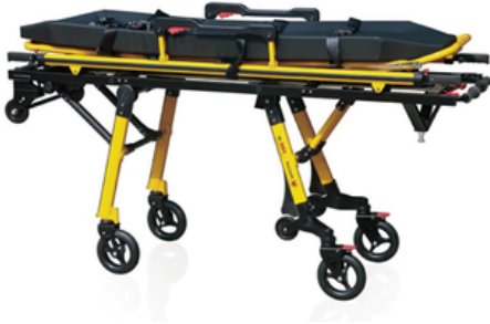
BRANCARD AMBULANCE - PREMIUM RECOVERY