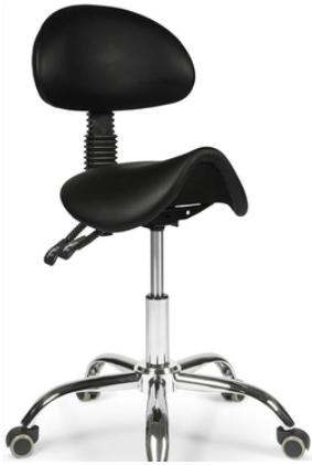
TABOURET AVEC DOSSIER ET ASSISE ERGONOMIQUE