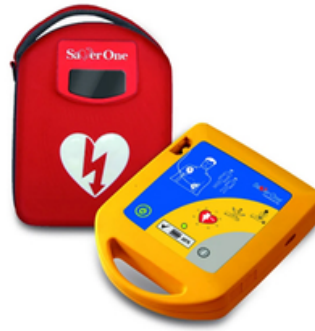
DEFIBRILLATEUR AUTOMATIQUE SAVER ONE