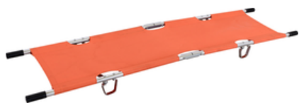
BRANCARD ALUMINIUM EVAC 00