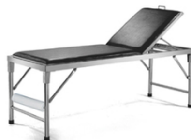
DIVAN D'EXAMEN EN INOX