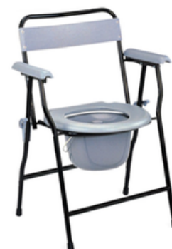
CHAISE POT PLIABLE NOIRE