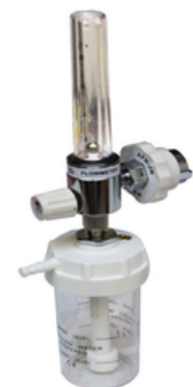
DEBITMETRE D'OX2 MURAL A BILLE ET HUMIDIFICATEUR