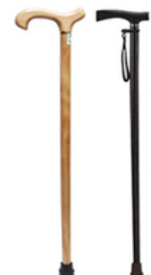
CANNE FIXE EN BOIS