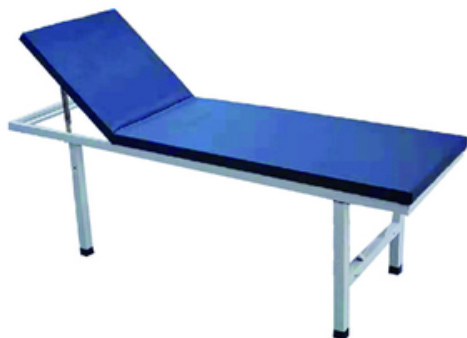
DIVAN EXAMEN EPOXY