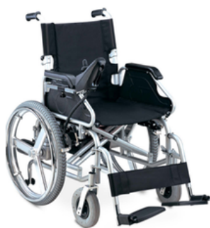
FAUTEUIL ELECTRIQUE - PREMIUM 2