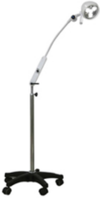
LAMPE D'EXAMEN MOBILE - 20 000 LUX (1M)