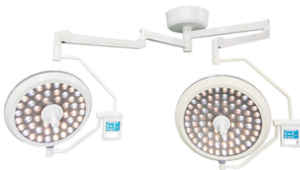
LAMPE SCIALYTIQUE OPÉRATOIRE PLAFONNIER