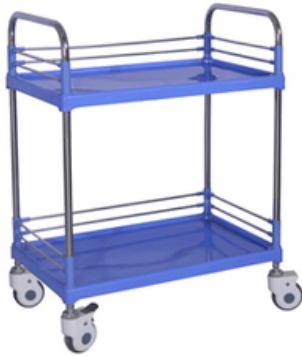
GUERIDON EN ABS 2 PLATEAUX