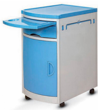
TABLE DE CHEVET EN ABS - SAIKANG