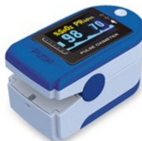
OXYMETRE DE DOIGT ADULTE BLEU