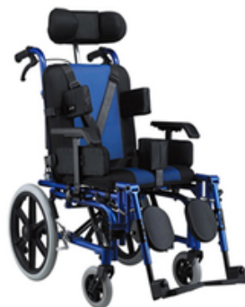
POUSSETTE ORTHOPEDIQUE EN ALUMINIUM IMC - ADULTE