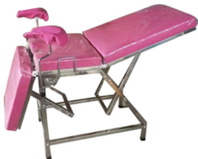
TABLE D'EXAMEN GYNECO EN INOX