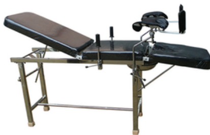
TABLE D'EXAMEN GYNECO EN INOX GYNECAS