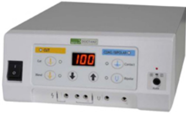
BISTOURI ELECTRIQUE MONOPOLAIRE / BIPOLAIRE 100W - DOTANZ