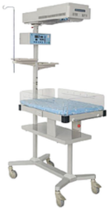
TABLE DE REANIMATION NEONATALE HKN-90