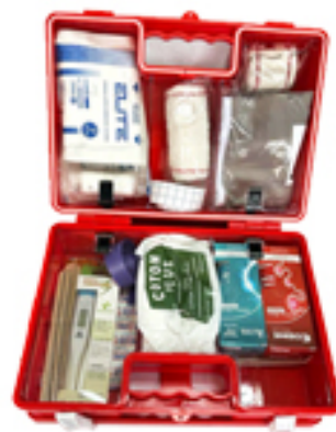
BOITE DE SECOURS EN ABS