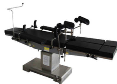
TABLE OPÉRATION ELECTRIQUE OPERA-E SK