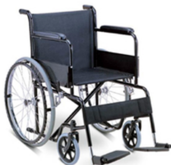
FAUTEUIL ROULANT ADULTE BASIC EPOXY'