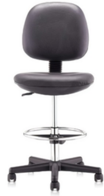
TABOURET POUR LABORATOIRE