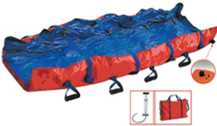
BRANCARD MATELAS COQUILLE AVEC POMPE