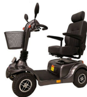
SCOOTER ELECTRIQUE CONFORT BLEU