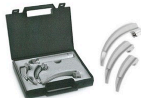
LARYNGOSCOPE FIBRE OPTIQUE