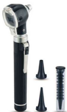
OTOSCOPE FIBRE OPTIQUE "ASP"