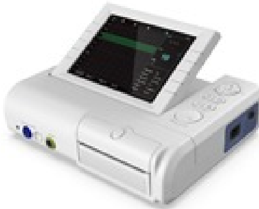
TOCOGRAPHE DIGITAL CARDIO SURVEILLANCE FOETALE