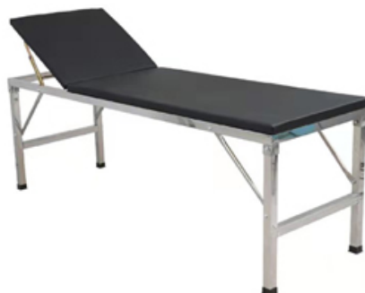
DIVAN EXAMEN INOX