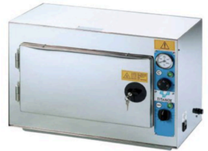
STÉRILISATEUR À AIR CHAUDS