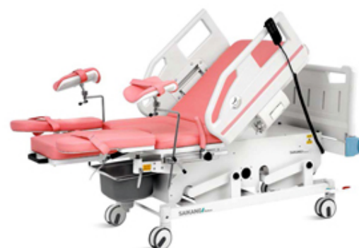
LIT OBSTETRICAL ELECTRIQUE - SAIKANG