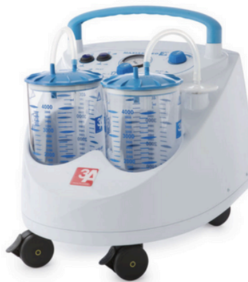
ASPIRATEUR CHIRURGICAL A PEDAL MAXI ASPEED 60 et 90- 2 BOCAL/2L