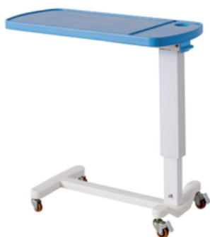
TABLE A MANGER 1 PATEAU EN ABS A VERIN A GAZ - SAIKANG