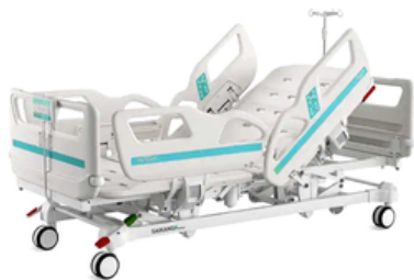
LIT DE RÉANIMATION ÉLECTRIQUE - SAIKANG