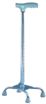
QUADRIPODE EN ALUMINIUM