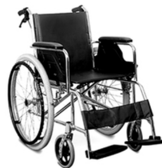
FAUTEUIL ROULANT ALUMINIUM ADULTE - BASIC