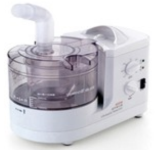
NUBELISATEUR ULTRASONIC YUWELL