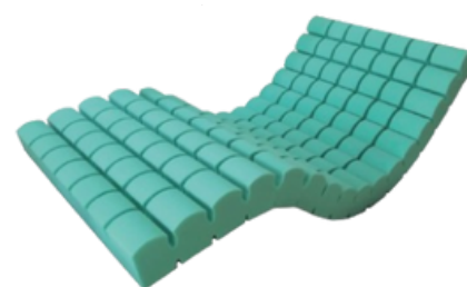
MATELAS SOMMIER GOFRIER ANTI-ESCARRES - SAIKANG