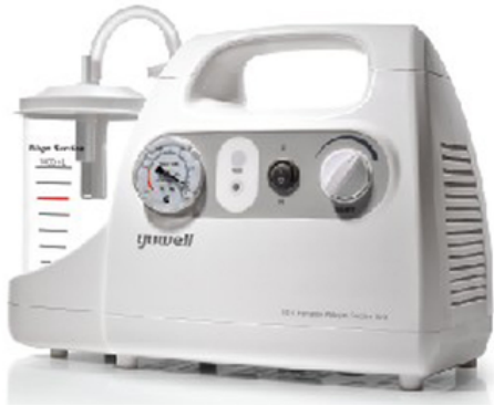
ASPIRATEUR ELECTRIQUE PORTABLE PHLEGM