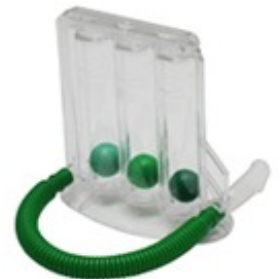
PEAK FLOW A BILLES INSPIRATION