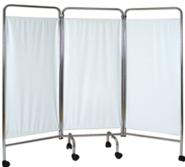
PARAVENT INOX 3 VOLETS