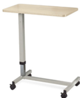
TABLE A MANGER EN BOIS VERIN A GAZ - 1 PATEAU - SAIKANG