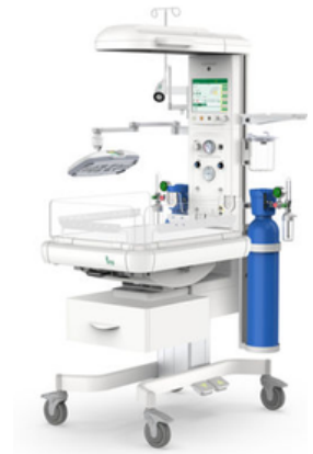
TABLE CHAUFFANTE ECASY 930