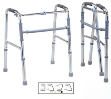
DEAMBULATEUR EN ALUMINIUM ARTICULE - ADULTE