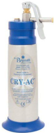
CRY-AC 5 - APPAREIL DE CRYOTHÉRAPIE POUR AZOTE LIQUIDE