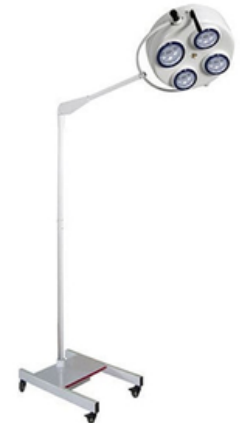
LAMPE SCIALYTIQUE LED MOBILE - A UNE COUPOLE - 80 000 LUX