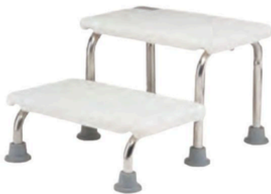
ESCABEAU DEUX MARCHE INOX