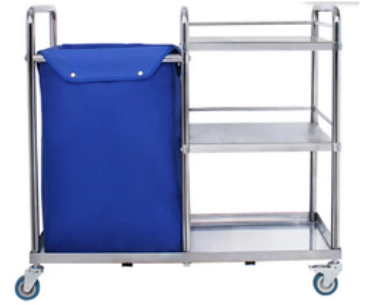
CHARIOT A LINGE SALE PROPRE EN INOX