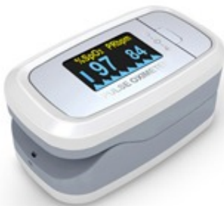
OXYMETRE DE DOIGT ADULTE BLANC