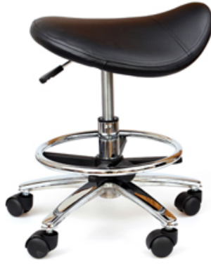
TABOURET ASSISE SELLE ROULANT AVEC CERCEAU