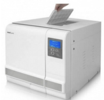
AUTOCLAVE 18 L OU 23 L MARQUE ICANCLAVE STÉRILISATION A VAPEUR