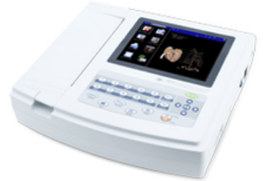
ECG AVEC INTERPRETATION 12 PISTES - CONTEC