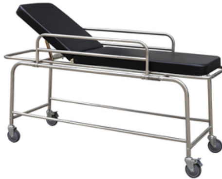
BRANCARD PASSE MALADE