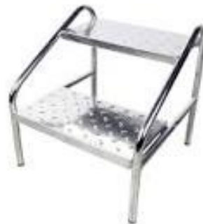
ESCABEAU EN INOX