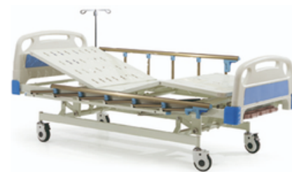
LIT HOPITAL MECANIQUE SERIMA 3 - Saikang