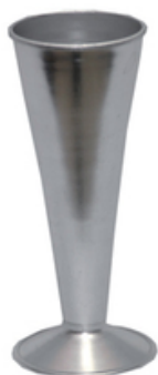
STETHOSCOPE OBSTETRICAL PINARD