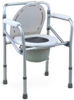
CHAISE CHROMEE FIXE AVEC BASSIN