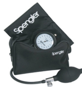
TENSIOMETRE SPENGLER "NANO" A VELCRO