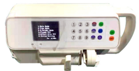
POMPE POUSSE-SERINGUE AUTO-POUSSEUSE - 01 VOIE - CONTEC