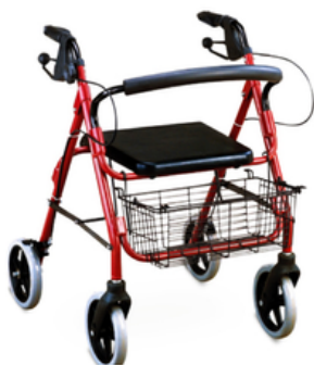
ROLATEUR EN ALUMINIUM A 4 ROUES