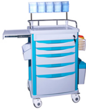
CHARIOT D'ANESTHESIE EN ABS