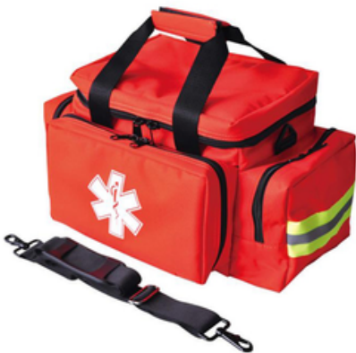
SAC D'URGENCE ET DE SECOURISME VIDE