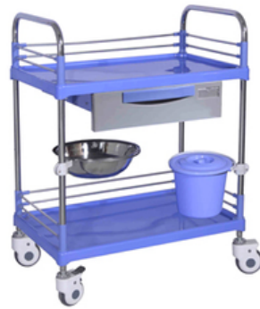
CHARIOT A PANSEMENTS EN ABS 2 ETAGERES