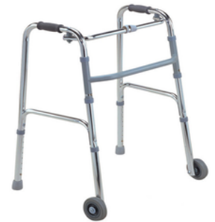
DEAMBULATEUR EN ALUMINIUM A 2 ROUES - ADULTE