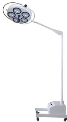
LAMPE SCIALYTIQUE LED MOBILE - A UNE COUPOLE - 100 000 LUX - AVEC BATTERIE