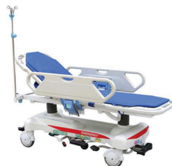
CHARIOT DE TRANSPORT HYDRAULIQUE