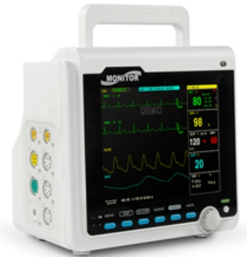
MONITEUR DE SURVEILLANCE MULTIPARAMETRES 21 CM - CONTEC