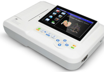
ECG AVEC INTERPRETATION 6 PISTES - CONTEC