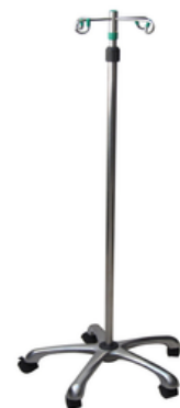
POTENCE A SERUM INOX 5 PIEDS CHROMES