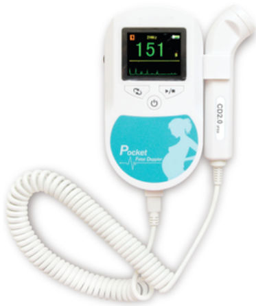
DOPPLER FOETAL ULTRA- SONIC 'SONOLINE-C' - CONTEC