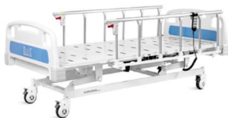
LIT ELECTRIQUE À 3 FONCTIONS - Saikang