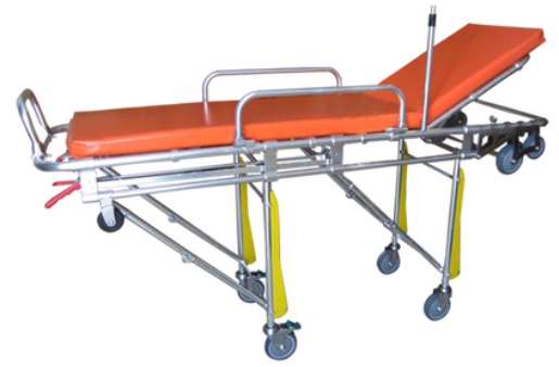
BRANCARD AMBULANCIER RABATTABLE - AMBULANCIA