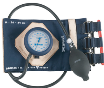
TENSIOMETRE SPENGLER 'HOPITAL II' A SANGLES