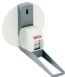
TOISE MURALE - SECA