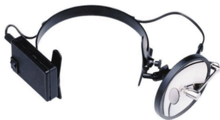
MIROIR DE CLAR