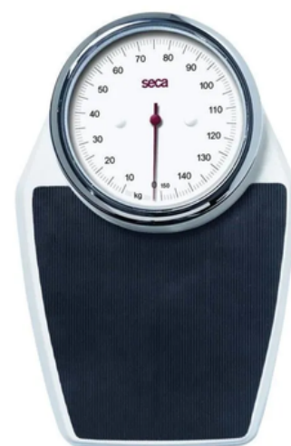
PÈSE-PERSONNE MÉCANIQUE CLASSIQUE SECA