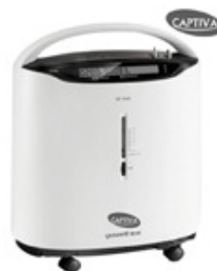
CONCENTRATEUR D'OXYGENE AVEC NEBULISEUR MOBILE - 5L/MIN Série CAPTIVA