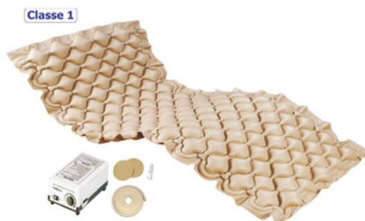
MATELAS A AIR + COMPRESSEUR 220V - SAIKANG