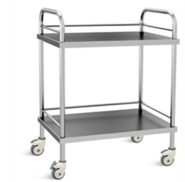
GUERIDON EN INOX 2 PLATEAUX