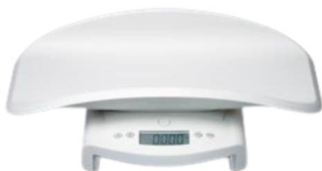
PÈSE-BÉBÉ ÉLECTRONIQUE UNIVERSEL - SECA