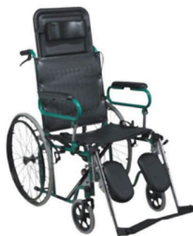
FAUTEUIL ROULANT DÉMONTABLE