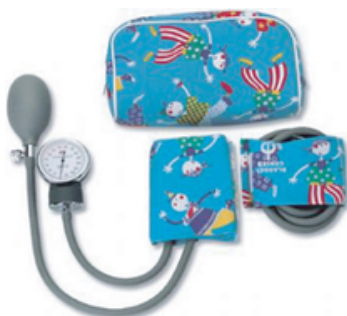
TENSIOMETRE A VELCRO MULTICOLORE ENFANT / N.NE