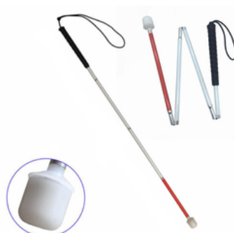
CANNE STICK NON VOYANT A BILLE TOURNANTE - LOCOMOTION