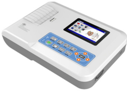
ECG AVEC INTERPRETATION 3 PISTES - CONTEC