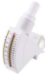
Peak flow a curseur