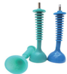
Jeux de 3 Cupules en silicones 50/60/70