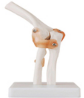
Articulation coude + Ligaments