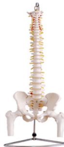
Colonne vertébrale + fémurs pvc