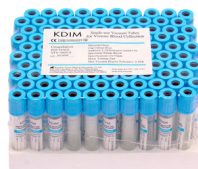
100 Tubes pour prélèvement PRP avec anticoagulant citrate de Sodium 3,2%