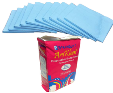
Alèse matelas jetable