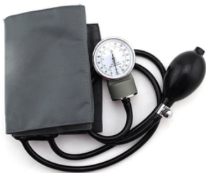
TENSIOMETRE ANEROID A VELCRO ADULTE