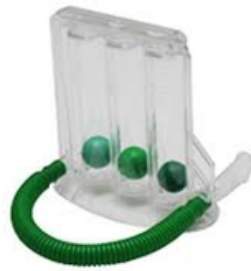
Peak flow a billes