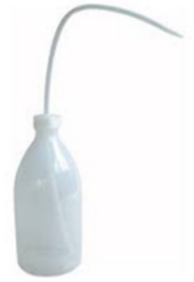
Pissette en plastique 100ml/250ml et 500 ml