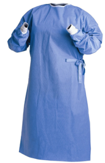
casaque chirurgicale stérile jetable