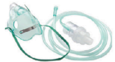
Kit de nébulisation