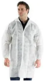
Blouse non tisse 40g