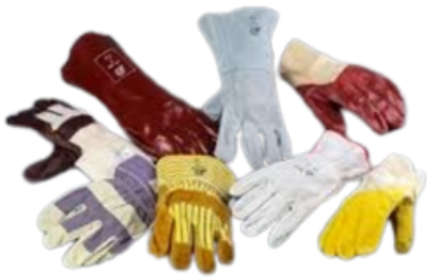
Gants de protection