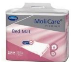
Alèse de 60x90cm jetable boîte de 20 u/u