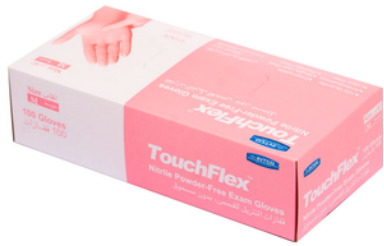
Gants d'examen en latex sritrang