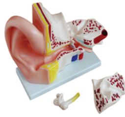
Oreille agrandi 5 fois 4 pièces