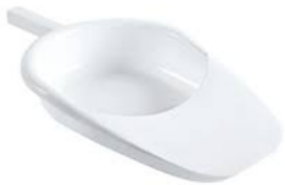
Bassin de lit