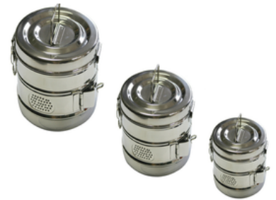
Tambours cylindriques en inox