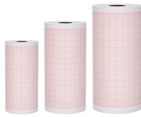
Rouleau papier pour ECG 3 pistes