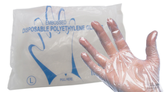
Gant d'examen 5doigts paquets de 100 unités