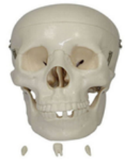
Crâne classique - pvc