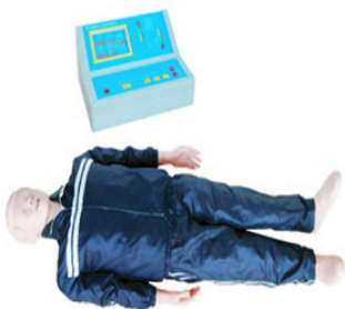
Mannequin corps complet RCR + boîtier guide contrôle "style 200"