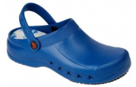
Sabot médical en plastique