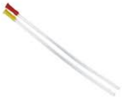
Sonde rectale stérile - 28