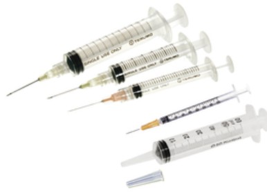
Seringue à usage unique jetable 1CC/2CC/5CC/10CC/20CC et 60cc