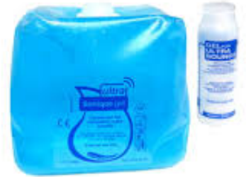
Gel échographie 5 KGS SONY