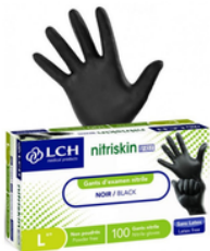
Gants d'examen nitrile non poudre noire