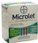
Les lancettes microlet bte 200/u