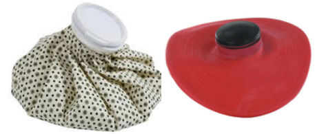
Vessie à glace ronde