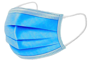
Masque 3 pli élastique et 4 lines