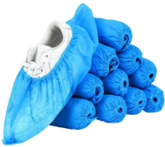
Sur chaussure jetable boîte de 100 u/u