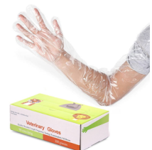
Boîte de gants Polyéthylène