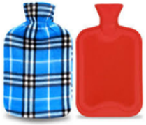
Bouillotte en caoutchouc sans housse