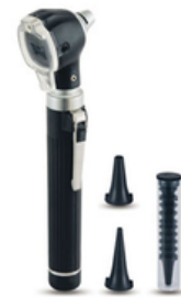
OTOSCOPE FIBRE OPTIQUE "ASP"