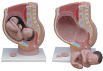
Coupe transversale bassin féminin