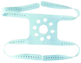
Serre tête pour masque anesthésie univ..