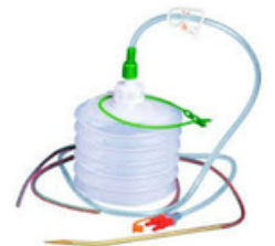
système de drainage HEMOVAC