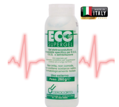
Tubé de gel ultrason de ECG