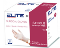
Gants d'examen - Latex stérils non poudre - boîte de 50 papiers