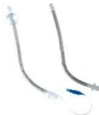
Sonde d'intubation armée