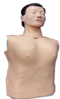
Mannequin de réanimation torses adulte homme