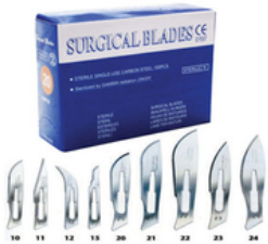
Boîte de lame de Bistouri de N°10 à N°24