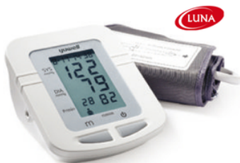
TENSIOMETRE DIGITAL BRASSARD YUWELL LUNA