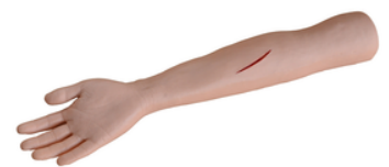
Bras pour sutures - modèle avance en pvc