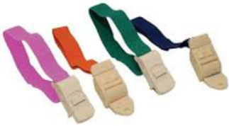
Garrot en tissu élastique avec crochet