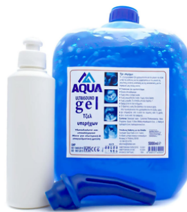
Gel d'échographe Aqua ultrasond bleu