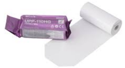
Papier pour Echo Sony 50 x 50 cm | Black 50 x 50 cm | Red