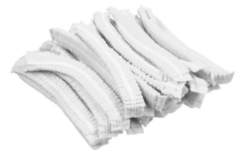
Charlotte jetable boîte de 100u/charlotte boîte de 100 unités