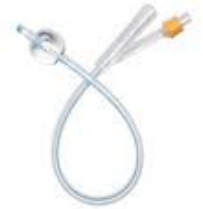
sonde urinaires Foley