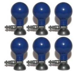
Electrode Ventouse métalique pour ECG paquet de 6