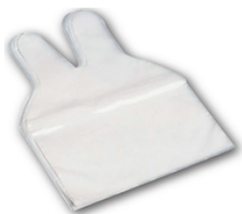
Boîte de gants deux doigts paquets de 100 unités