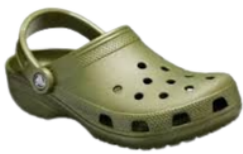
Sabot médical en plastique vert