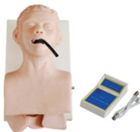
Modèle de formation et d'intubation chez l'adulte