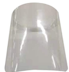
protège écran facial