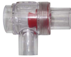
valve ambu. p/ réanimateur