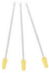
Curette aspiration "karman"