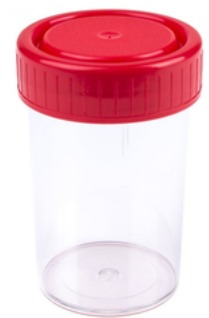
Flacon 60ml/125ml pour analyse