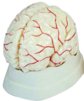
Cerveau taille réelle 8 pièces