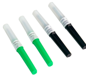
Tubes à vide pour prélèvement sanguin / kdim