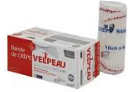
bande de velpeau