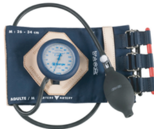
TENSIOMETRE SPENGLER 'HOPITAL II' A SANGLES