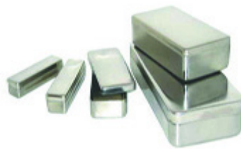
Boîtes Instruments inox