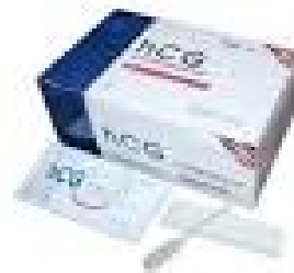
Test de grossesse