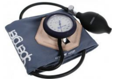
TENSIOMÈTRE VAQUEZ LAUBRY HÔPITAL VELCRO