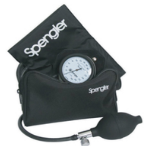
TENSIOMETRE SPENGLER "NANO" A VELCRO