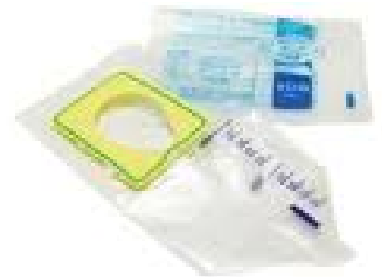
Urinal pour bébé