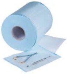
Gaines de stérilisation / sterifit