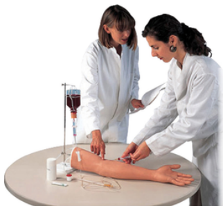
Bras d'injection intraveineuse