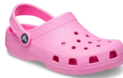
Sabot médical en plastique rose