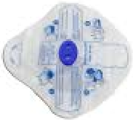
Masque bouche a bouche réanimation