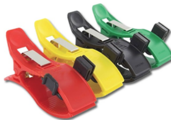
Pince pour ECG paquet de 4 (Noire, rouge, vert et jaune)