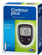
Glucomètre contour plus