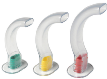
Canule de Guedel