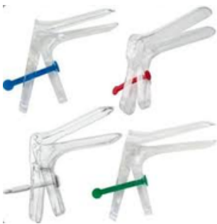
Speculum usage unique jetable boite de 10