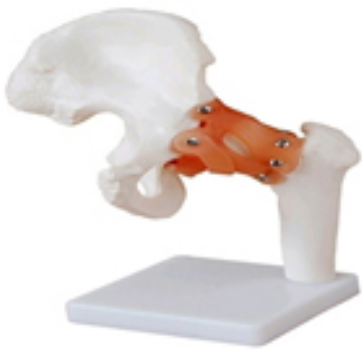
Articulation Genou+ Ligaments