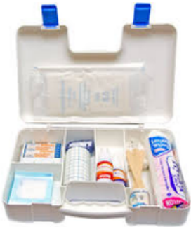
Trousse de premiers secours complète