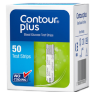
Bandelettes contour plus bte 50/u