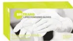
Gant d'examen - latex poudre