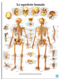
Planche Anatomique squelette Humain voir autres modèles