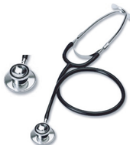
STETHOSCOPE "DUAL" 2 PAVILLONS