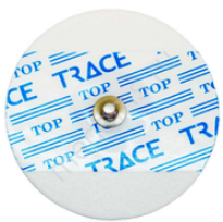
Electrode usage unique pour ECG boîte de 40