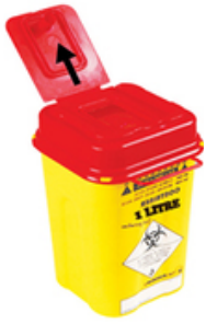
Conteneur en plastique pour objets tranchants 3L/5L/7L