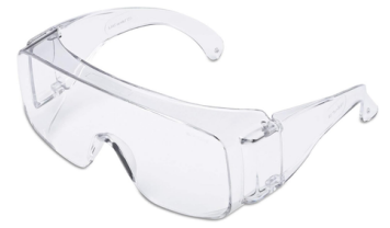
Lunettes PVC de protection