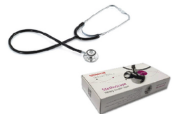
STETHOSCOPE DOUBLE PAVILLONS YUWELL