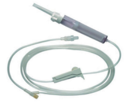
perfuseur à filtre avec raccord en Y