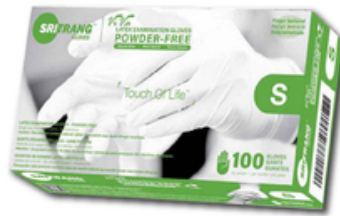
Gants d'examen - Latex non poudre - Taille S/M/L