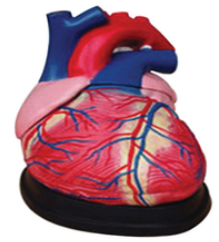
Cœur agrandi 4 fois 3 pièces