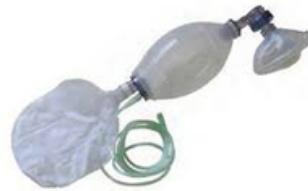
Ambu réanimateur silicone enfant et adulte et nourissant