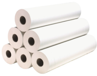
Drap d'examen en papier carton de 12