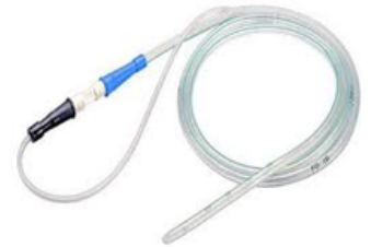
Sonde Salem de NUTRITION PVC