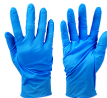
Boîte de gants d'examen nitrile non poudre