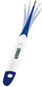
THERMOMETRE DIGITAL FLEXIBLE - CONTEC