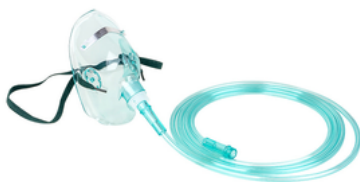
Masque d'oxygène avec tuyau