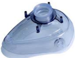
Masque anesthésie silicone