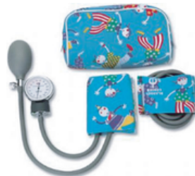
TENSIOMETRE A VELCRO MULTICOLERE ENFANT / N.NE