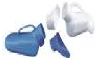
urinal plastique mix