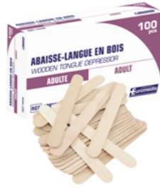
Abaisse langue en bois adulte - Boîte de 100